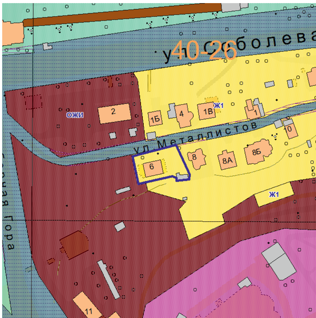
СХЕМА расположения земельного участка с кадастровым номером 67:27:0031904:19 по адресу: Российская Федерация, Смоленская область, город Смоленск, улица Metallistov, дом 6

Приложение к постановлению Главы города Смоленска от _____ № _____