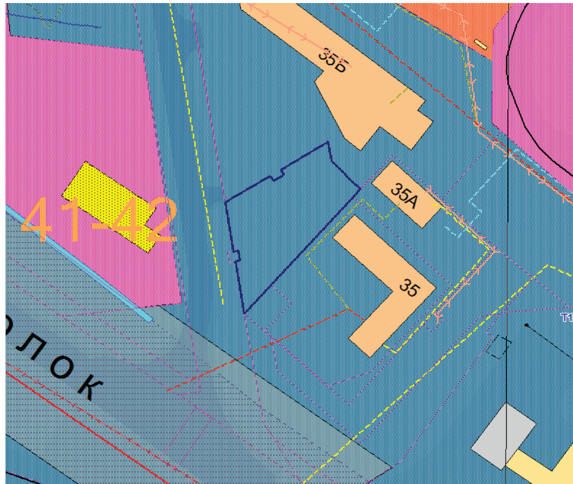
СХЕМА расположения земельного участка с кадастровым номером 67:27:0030432:552 по адресу: Российская Федерация, Смоленская область, город Смоленск, улица 2-й Верхний Волок

Приложение к постановлению Главы города Смоленска от _____ № _____